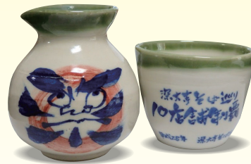
特製そば猪口+とっくり(デザインは選べません)