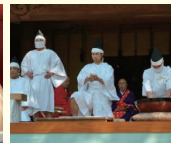
そば守観音供養祭

そば守観音供養祭で献上された特別なそばを、神聖な場所である、深大寺の庫裡にてご提供します。